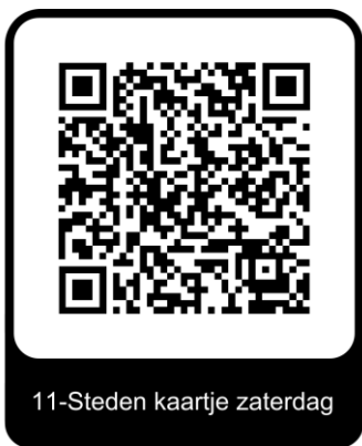
11-Steden kaartje zaterdag

Bij de Rode Kruisposten is blaarbehandeling. Bij de start en finish is geen Rode Er is in Leeuwarden geen mogelijkheid om te douchen.